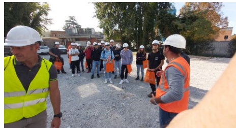
Foto dell'esperienza, sempre rivolta agli studenti CAT, CostruiAMO Sicurezza , organizzata con lo SPISAL - Padova